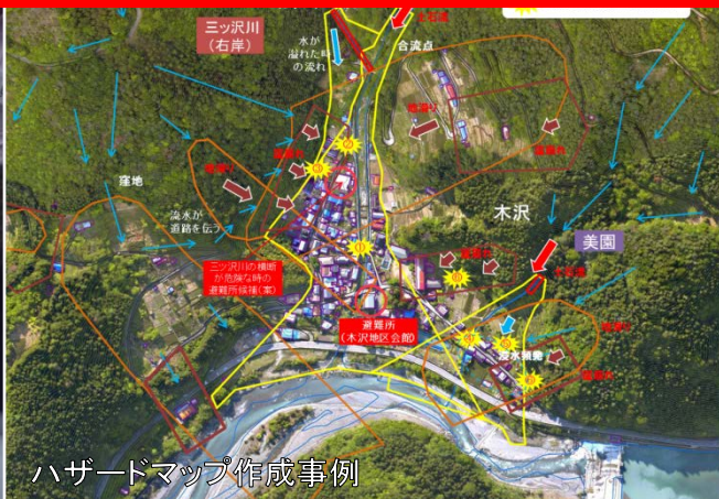
ハザードマップ作成事例

土砂災害は、いつ・どこで発生するのか事前に予測することが困難な災害です。このため、地域の高齢者や乳幼児を含めた住民が安全に避難するためには、今何が必要（大切）なのか、自らの問題として考えることが重要です。