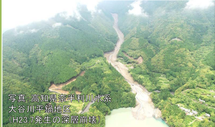
写真：高知県奈半利川水系 大谷川平鍋地区 (H23.7発生の深層崩壊)