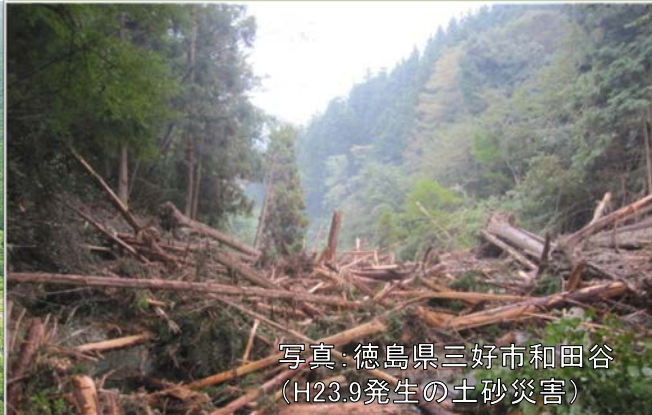
写真：徳島県三好市和田谷 (H23.9発生の土砂災害)