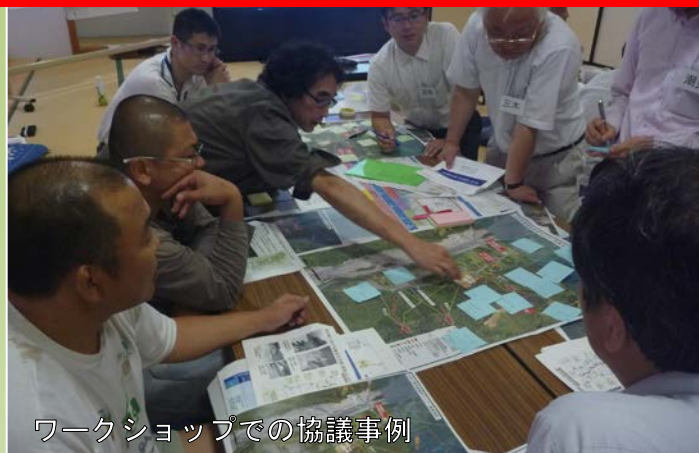
ワークショップでの協議事例