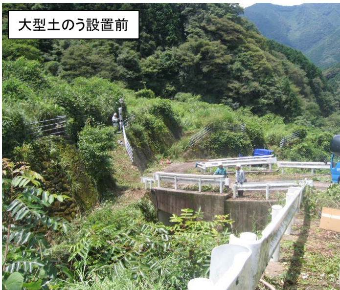
大型土のう設置前