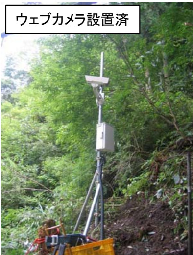
ウェブカメラ設置済