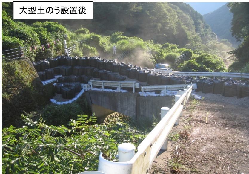
大型土のう設置後