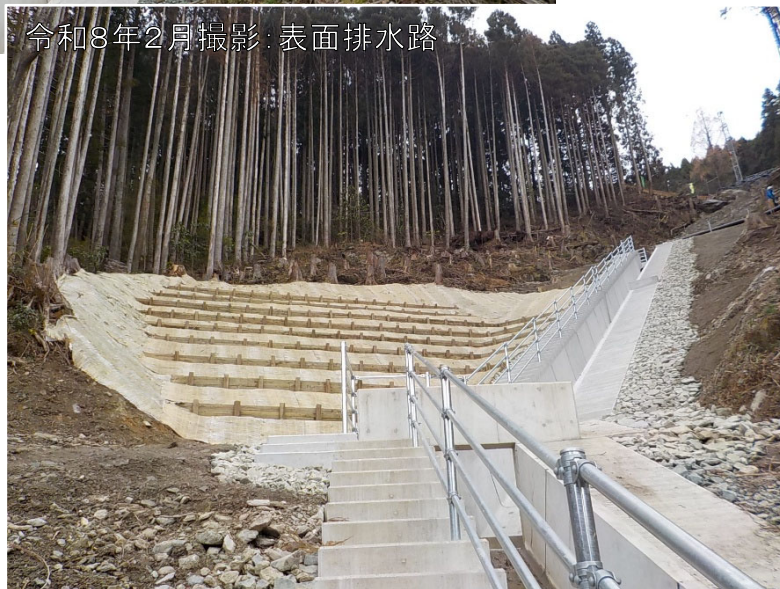
令和8年2月撮影:表面排水路