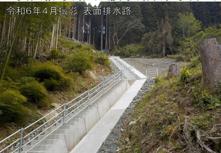
令和6年4月撮影:表面排水路