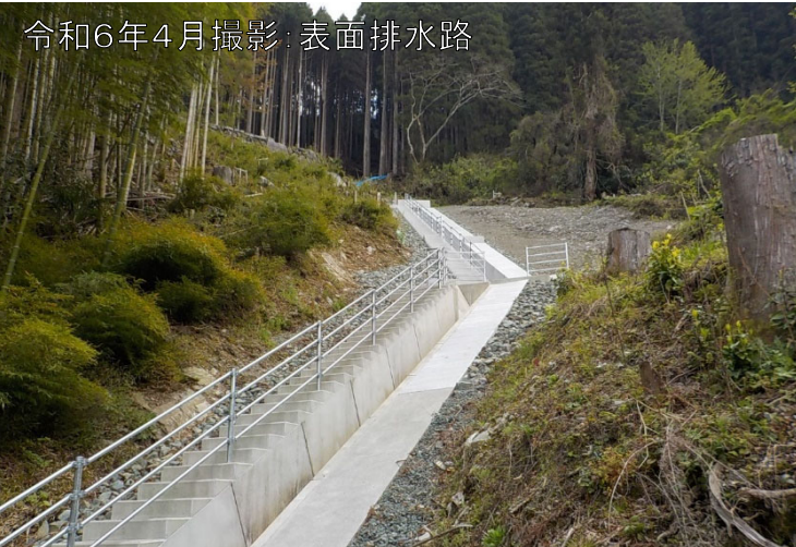
令和6年4月撮影:表面排水路

表面排水路:山腹水路の施工中、集水井:(W-11)の集水井内ボーリングが完了しました