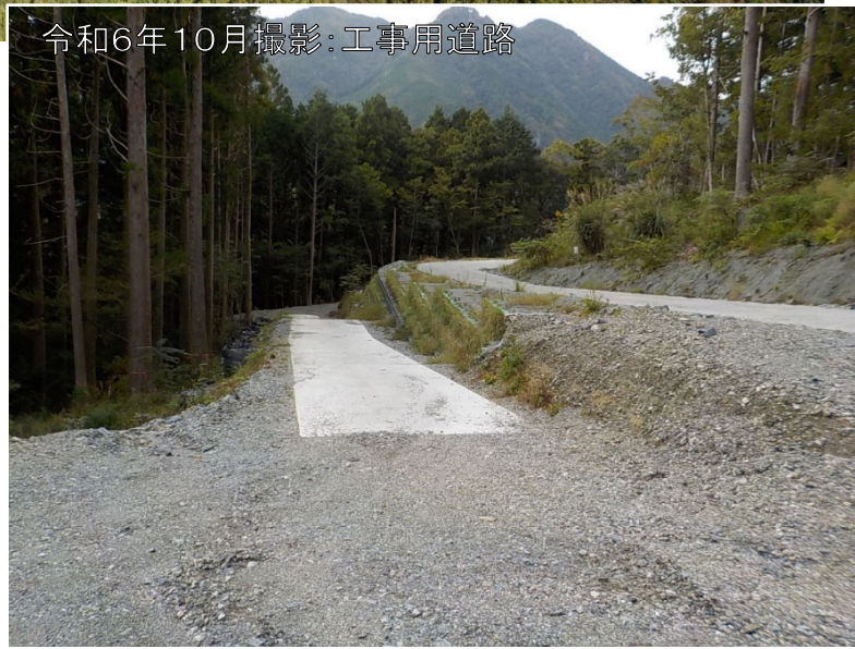
令和6年10月撮影:工事用道路