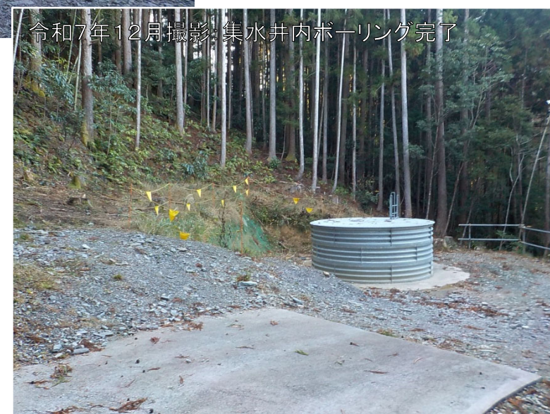
令和7年12月撮影:集水井内ボーリング完了