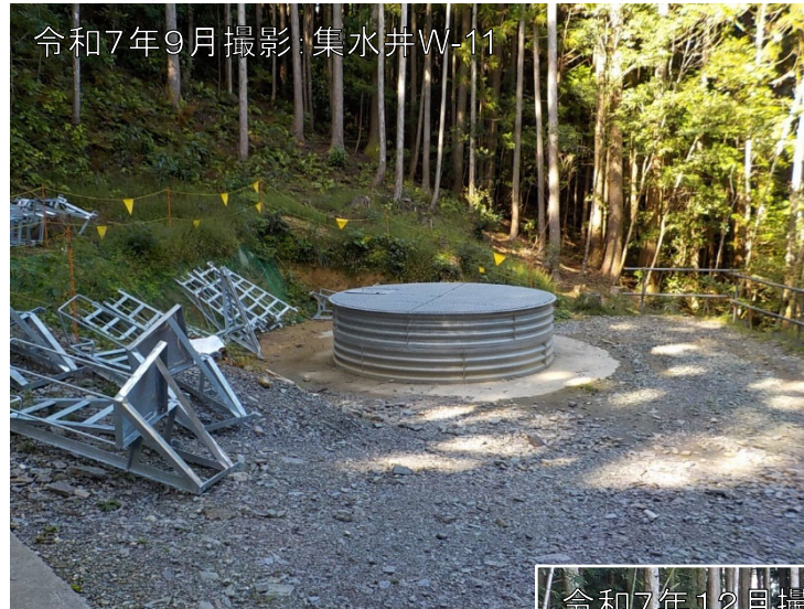
令和7年9月撮影:集水井W-11