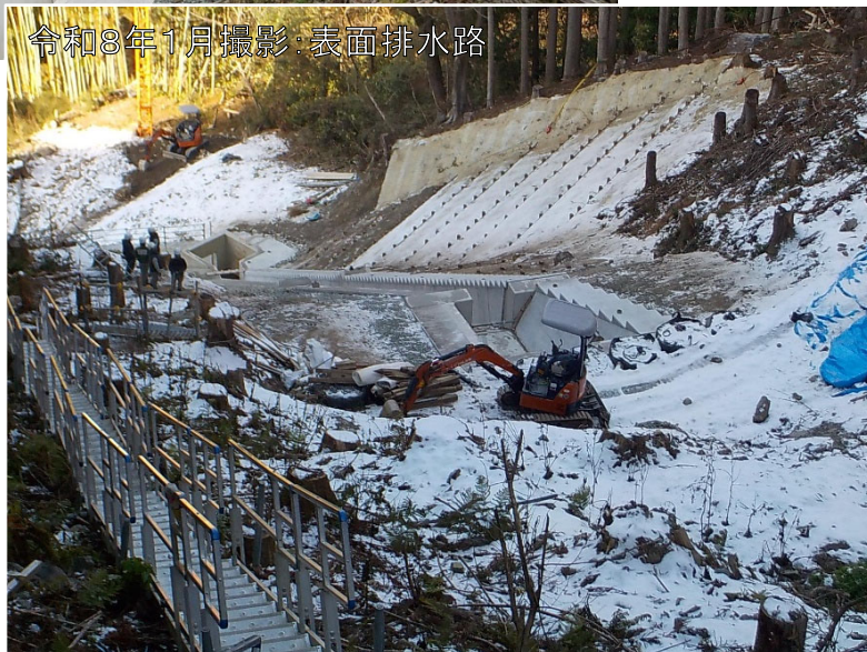
令和8年1月撮影:表面排水路