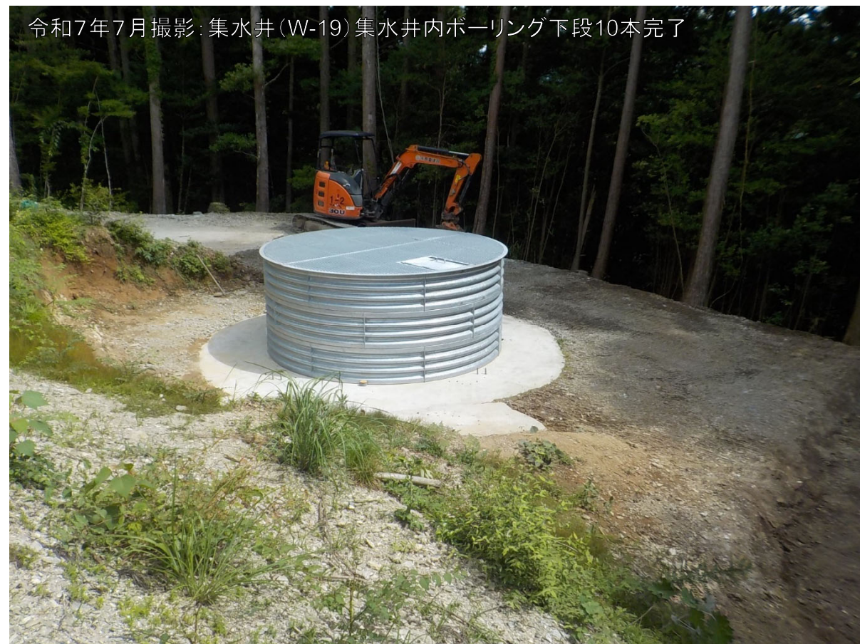
令和7年7月撮影:集水井(W-19)集水井内ボーリング下段10本完了