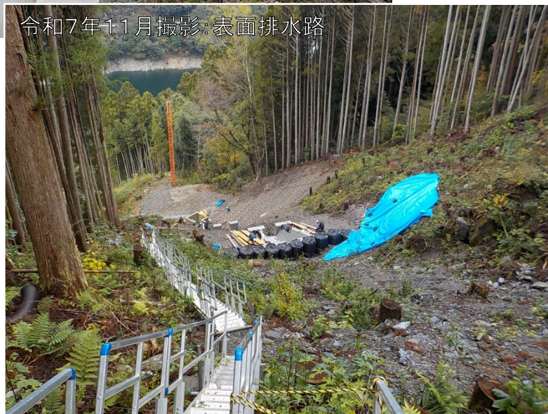
令和7年11月撮影:表面排水路