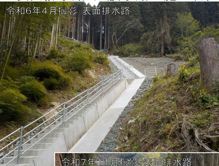
令和6年4月撮影:表面排水路