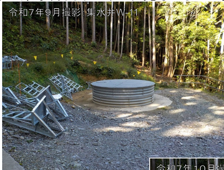
令和7年9月撮影:集水井W-11