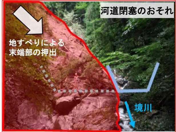
河道閉塞のおそれ