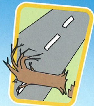
車道の障害物など