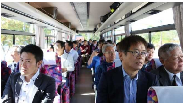
バス車中からも「秀逸な道」等の美しい景観を楽しめました

バスエクスカーションには、40名が参加し、ニセコ町のまちづくり関連施設等についてニセコ町長の片山健也氏によるガイドを受けました。また、「秀逸な道」区間や「ビューポイントパーキング(倶知安町八幡地区・喜茂別町相川地区)」では、支笏洞爺ニセコルートで行われている美しい景観を守り、育てる活動等について、地域活動団体メンバーから紹介があり、立寄り先では、越冬ニンジンジュースや枝豆等が提供されました。