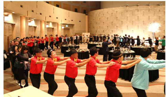
会場が一つの輪になった「三百六十五歩のマーチ」