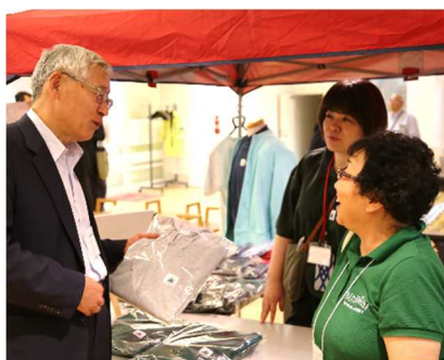
シーニック×日本風景街道コラボグッズ (シーニックバイウェイ支援センター)