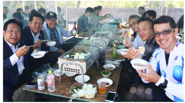
北海道らしいソバーペキューに参加者も大満足