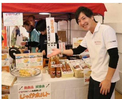
NPO 法人 WAO ニセコ羊蹄再発見の会 (支笏洞爺ニセコルート)