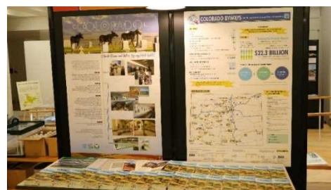
コロラドシーニックバイウェイの展示の様子

今回、パネリストとしても、ご登壇いただいたコロラドシーニックバイウェイ関係者から、温泉と歴史的資源を重要な観光資源として活用し、サンファン・スカイウェイやアルパイン・ループを中心としてコロラドシーニックバイウェイで取り組んでいる道づくりの活動等を紹介するポスターの展示とパンフレットの配布を行いました。