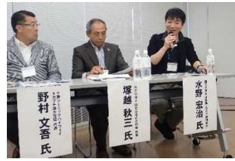
テーマ2. シーニックハイウェイとビジネス(活動の継承)の様子