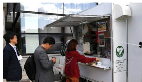
シーニックカフェの様子

道路協力団体の取組みとして、現在、支笏洞爺ニセコルートで展開中のシーニックカフェ(移動販売車)も、今回、特別に出店しました。通常販売しているソフトクリームに加え、十勝シーニックバイウェイ十勝平野・山麓ルートから、特別にブレンドされたオリジナルコーヒー「ひなたぼっこブレンド」を販売し、参加者からも大変好評でした。