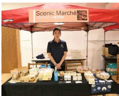
(株)ニセコリゾート観光協会 (支笏洞爺ニセコルート)