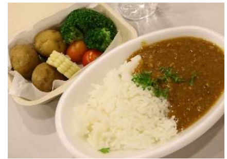
心温まるランチに参加者も大喜び