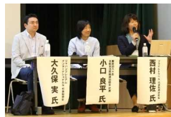
テーマ1. シーニックバイウェイとインバウンド(観光地域づくり)の様子