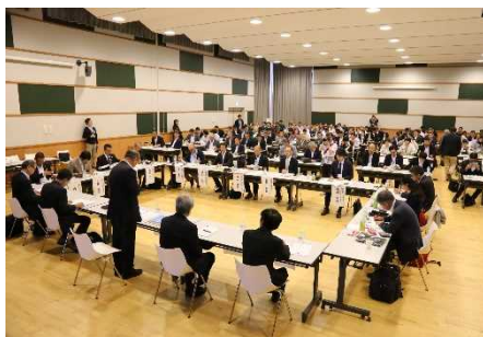
第16回 シーニックバイウェイ北海道 推進協議会 会議の様子