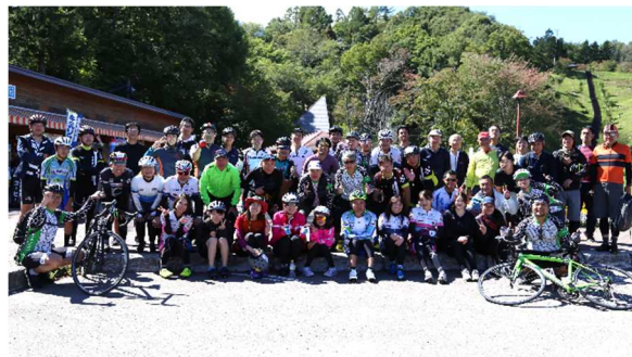
ゴールの「道の駅名水の郷きょうごく」での記念写真