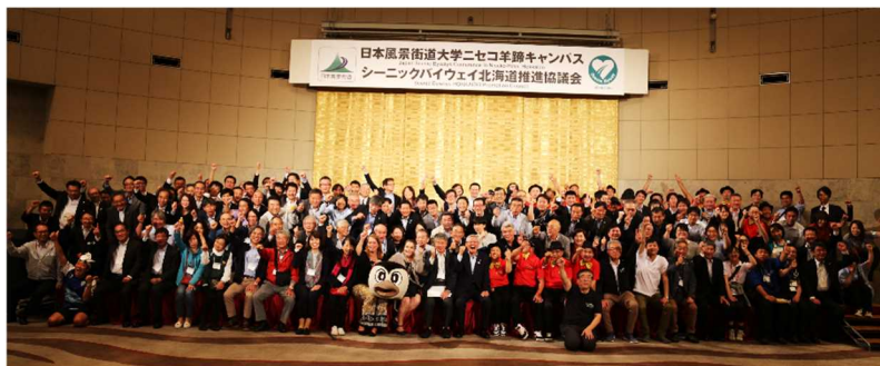
参加者全員での記念写真