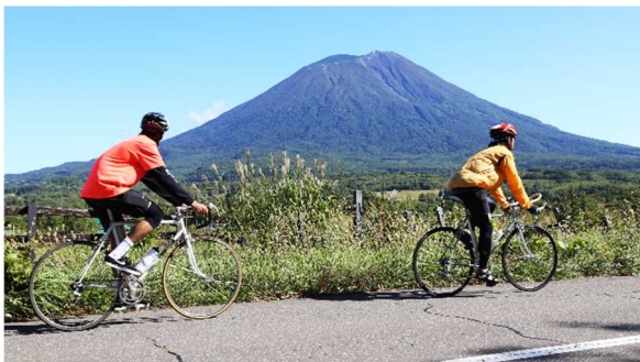
羊蹄山を背景に心地よいライド

自転車エクスカーションには、40名が参加しました。秋晴れで絶好のサイクリング日和の中、今年度新たに整備されたサイクル拠点スタート地点とし、常に羊蹄山を眺めながら、ニセコ町と真狩村、京極町の各所(約40km)を自転車でめぐり、エドポイントでは、ご当地の食や飲み物等を楽しんでいただきました。