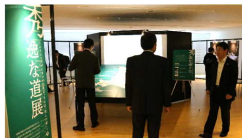
「秀逸な道展」の様子

シーニックバイウェイ北海道にて、現在試行中である全道 15 区間の「秀逸な道」の取組みについて、大型パネルや映像等を使って紹介しました。また、「秀逸な道展」の会場中央部では、シーニックバイウェイ北海道の歩みや後志地域を象徴する国道 229 号のプロモーション動画を大型スクリーン(100 インチ)に投影しました。