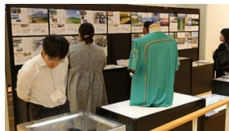
包括連携協定企業等の取組紹介の様子

シーニックバイウェイ北海道と「包括連携協定企業」及び「協力団体及び機関」の連携による、さまざまな取組を紹介するとともに、パンフレット、出版物等の各種コラボグッズを展示しました。