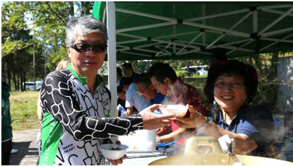
くっちゃん名物「いもっこ汁」も振舞われました