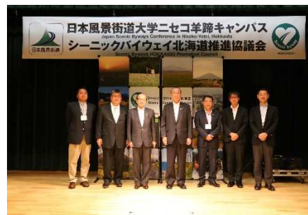
新たに候補ルートに登録された 知床ねむろ・北太平洋シーニックバイウェイ