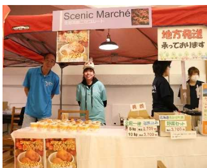
NPO 法人きもべつ WAO (支笏洞爺ニセコルート)

全国各地からの参加者に対するおもてなしメニューの目玉として、シーニックバイウェイ北海道の2ルート及びシーニックバイウェイ支援センターが「シーニックマルシェ」に出店しました。それぞれの地域の特産品やオリジナルグッズ等を販売することで各地からの参加者との交流も楽しんでいました。