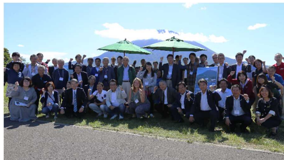
電線類の見えない化の取り組みが行われた「八幡ビューポイントパーキング」での記念写真