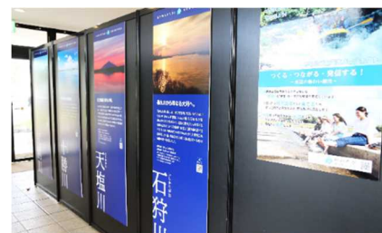
「かわたびほっかいどう」活動紹介の様子