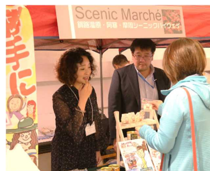
勝手におすすめ委員会 (釧路湿原・阿寒・摩周シーニックバイウェイ)