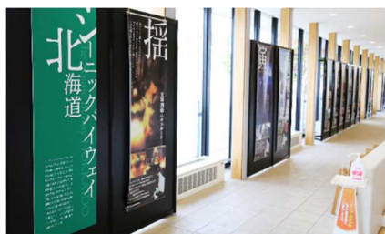
シーニックバイウェイ北海道活動紹介の様子

エントランスでは、「シーニックバイウェイ北海道」の各ルートで行われている活動を紹介するタペストリー(写真左・中央)と、シーニックバイウェイ北海道と連携した取組を進め、水辺利活用を促進し、地域づくり・観光振興に貢献している「かわたびほっかいどう」の活動について紹介するパネル(写真右)を展示しました。