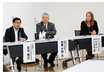
テーマ3. シーニックハイウェイと景観づくり(景観の保全と活用)の様子