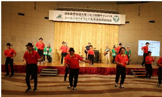
「おやじダンサーズ」とスペシャル楽団による饗宴

おもてなしステージでは、ホストルートである支笏洞爺ニセコルートの有志「おやじダンサーズ」とスペシャル楽団が交流会を大いに盛り上げました。おもてなしステージ3曲目の「365歩のマーチ」では、参加者全員が1つの大きな輪になり、その光景は圧巻でした。交流会の最後には参加者全員で記念撮影をしました。