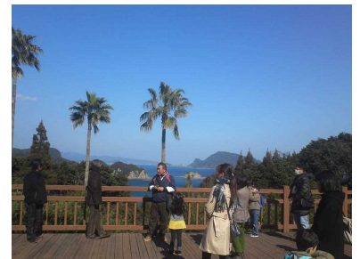
「道の駅」を巡るバスツアー