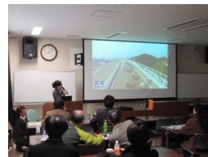
2日目の全体講義の様子