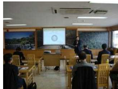
専門家を招いての講演会