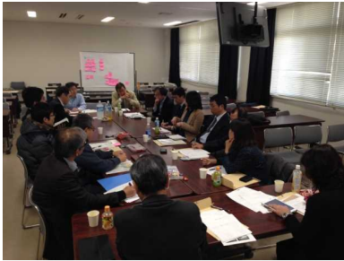
グループ討論の様子