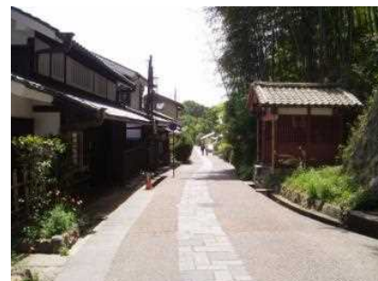
左側の建物が「京都市嵯峨鳥居本町並み保存館」