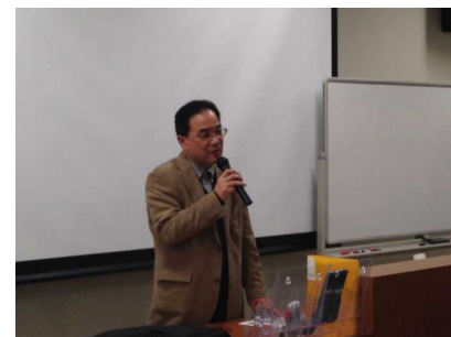
1日目の全体講義の様子

平成27年1月9日(金)～11日(日)の3日間にわたり、日南海岸地域シーニックハイウェイ推進協議会及びNPO 法人日本風景街道コミュニティ主催の今年で5回目となる日本風景街道大学本校が、宮崎大学木花キャンパス等にて開催されました。一般の方々や行政関係者など県外の方約40名を含む約140名の方々が参加されました。今回の風景街道大学では、風景街道における道の駅をテーマに、道の駅の現状と今後の展望、日本風景街道と道の駅の連携のあり方を話し合う場として開催されました。