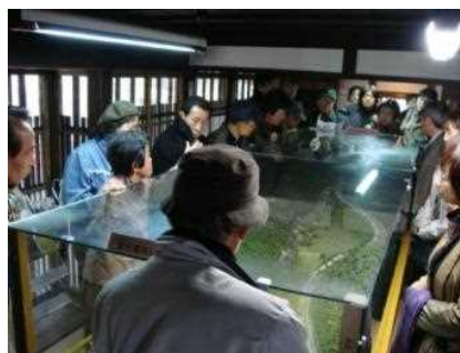
案内の様子。地域の概要説明では、「京都市嵯峨鳥居本町並み保存館」にあるジオラマを活用します。