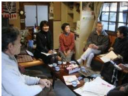
膝詰めで行う小規模なワークショップを何度も開催してきました

地域の方々、そして NPO や保勝会のメンバーでは、愛宕街道の魅力を再発見し共有するとともに、来訪者の目線で課題を発見していくワークショップを開催してきました。建築家や郷土史家など各種専門家を招いた講演会等もこれまで幾たびも実施してきました。その中で「嵯峨鳥居本について詳しく解説している英語ガイドブックは、実は少ない」「歴史文化をいかしたまちづくりと観光地づくりの両立の秘訣」などの新たな気づきがありました。また、ワークショップは地域の内外の人が話し、交流する機会にもなっており、外の目線からこの地域の魅力を改めて聞かされることによる再発見も重ねられています。