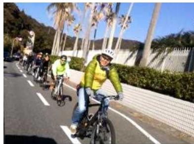
日南海岸きらめきラインを楽しむサイクリング

サイクリングでは、休むところにバイクラックがない、国道 220 号は路側が狭いという声も聞かれ、日南海岸線をサイクリングコースとして活用するための課題も見つかりました。