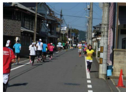
マラソン大会 レース状況