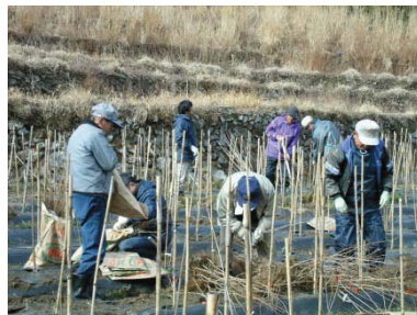
さくらの苗畑づくり