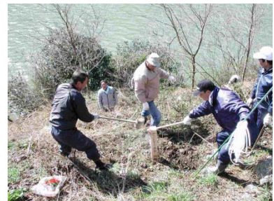
さくらの植樹状況