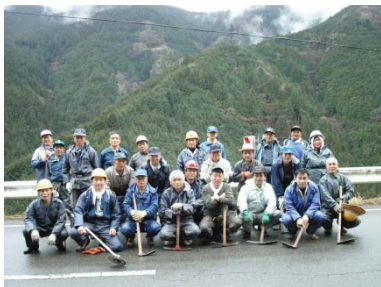
柳谷壮年会メンバー

柳谷 やなぎだに 壮年会が、平成15年から取り組んでいる事業で、5万本のさくらを地域内に植樹し、50年後に日本一のさくらの里とすることを目指しています。桜の苗木は、しっかり伸びるように種から育て、2年ほどで植樹できるようにしています。種蒔き、苗畑づくり、除草下刈りなどの作業は、90人の壮年会メンバーだけでなく地域の方々も積極的に参加し、一年一年桜色に染まる山が広がっており、地域ぐるみで「さくらの里づくり」を進めています。