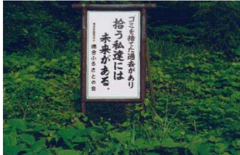
間伐材を利用した看板