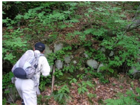
明治の道の道路擁壁の調査