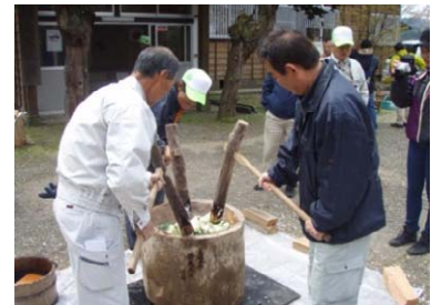
昼食時の餅つき状況