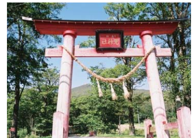
霊山・兜明神岳と兜神社（宮古市）