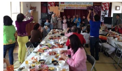
地元がもてなす漁師料理は大好評