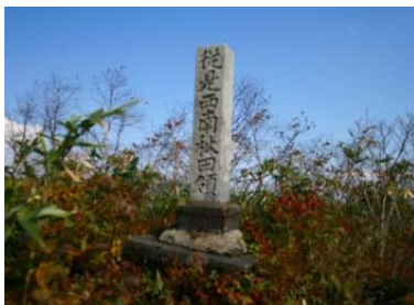
秋田藩と盛岡藩の藩境に立つ碑