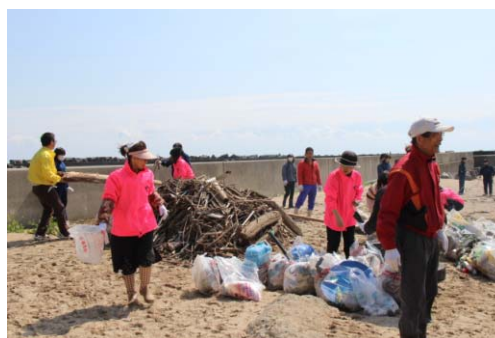
サーフィンスポットのビーチクリーン