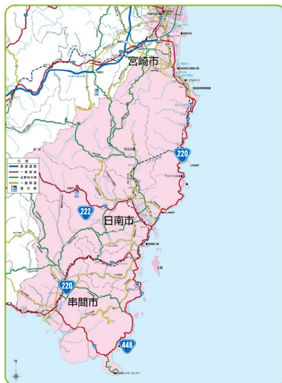
日南海岸きらめきラインエリア図

そのエリアで、それぞれの活動テーマを持つ地域愛あふれる 45 の団体と個人が、「日南海岸地域で生まれて良かった、育てて良かった、そして、訪れた人に感動を与え、また来るよと言われるような地域をつくろう」を合言葉に、うつくしの道づくり いやし・もてなしの道づくり 神話と歴史の道づくりの3つを活動の柱として、日々活動を繰り広げている。