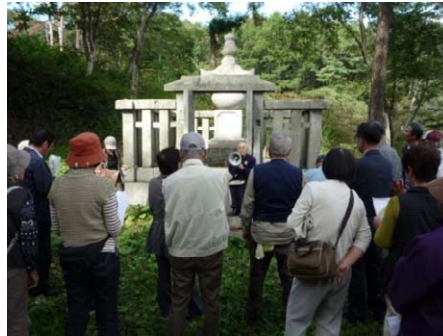
南部藩士墓所の説明