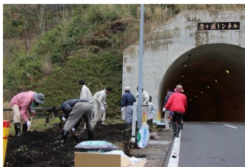
沿道にカナナを植える活動