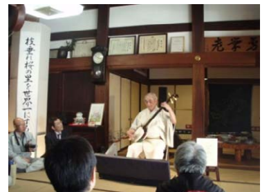
津軽三味線演奏会