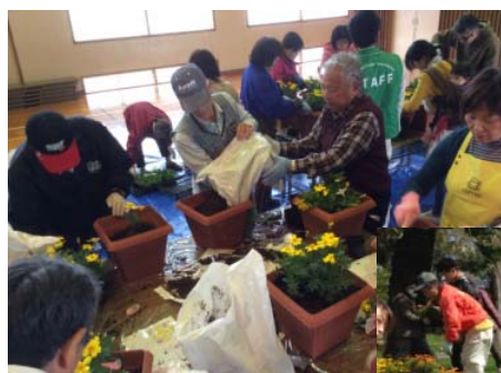
家々の門を飾るプランターづくり「まちかど寄せ植え教室」

日南海岸きらめきラインでは、自治会や学校に活動のチラシを配布し、活動団体だけではなく、地域住民が活動の主役になれるような工夫をしている。