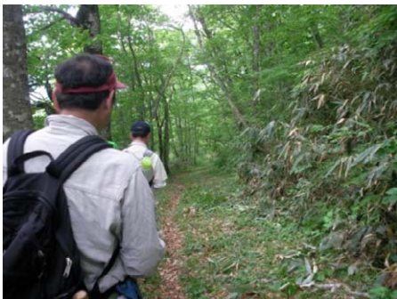
歴史街道(明治の道)の実地調査

国見峠・仙岩峠には江戸時代と明治時代に利用されていた道がそれぞれ残されており、当時の痕跡を大いに感ずることが出来ます。一般参加者を対象とした探訪会等も実施しており、歴史街道に詳しい先生をお招きして秋田街道の魅力を伝える活動や、ホームページを利用した情報発信を展開しています。