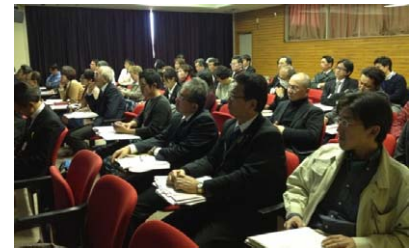
多彩な講師陣の講義に、参加者も興味津々