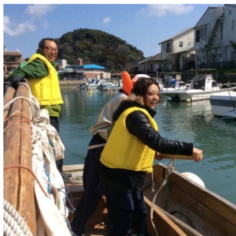
マグロ漁に使われたチョロ船の乗船体験（堀川運河）