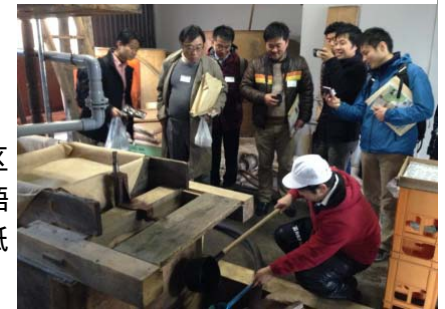
江戸時代からの製法を守る醤油蔵