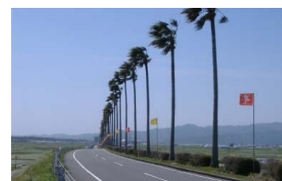
道路中央のワシントンニアパームは、宮崎のシンボルの景観