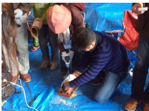
竹灯籠づくり体験