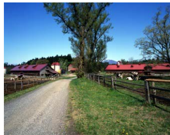
小岩井農場（雫石町）