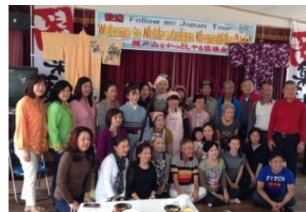
もてなす側ともてなされる側と一緒に記念写真