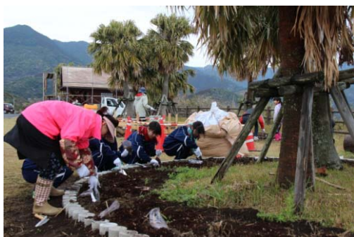
トンネルが開通し、バイウェイになった展望台(ポケットパーク)にカナナを植える活動