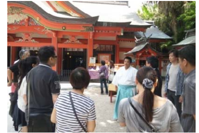
神官さんが神社にまつわる神話を語る