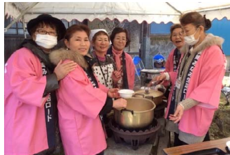
地どれの魚と昔から伝わる魚うどん、地域の文化を楽しむ。