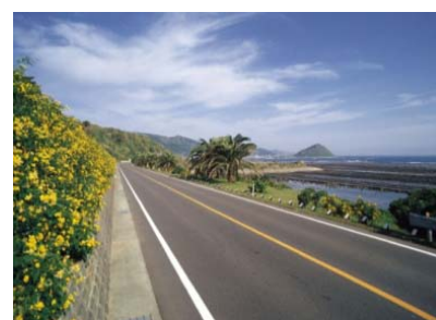
コバノセンナの黄色が空と海の青を一層引き立てる沿道景観

そしてこの美しい風景は宮崎県の風土として根付き、花みどりあふれる美しい景観を愛するという宮崎県民の文化を育てたのである。