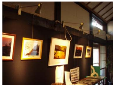
古民家ギャラリー