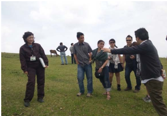
都井岬野生馬の生態を語るガイドの話にツアーも盛り上がる