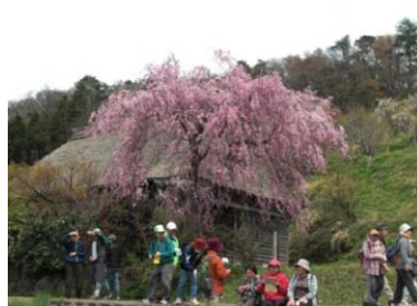
枝垂れ桜を満喫する参加者