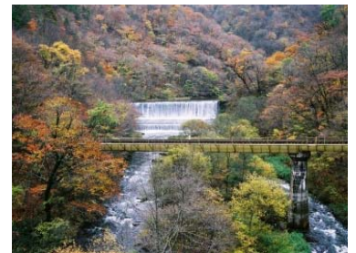
大峠ダムと JR 山田線（宮古市）