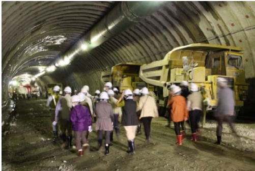
宮古盛岡横断道路 新川目トンネルの見学

前回(平成 25 年 10 月)実施の 106 の日ウォークでは、「復興支援道路」として整備が進められている「都南川目道路 新川目トンネル」の工事現場見学を通して国道 106 号の必要性・重要性を考えたほか、盛岡市にある寺院で宮古に深いゆかりのある聖壽寺・東禅寺の見学を通して旅日記の舞台である江戸時代の情緒に触れることが出来ました。このイベントは参加者を一般募集していますが、大変好評を頂き、例年多数の方に御参加いただいております。