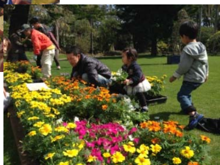
オープニングイベントの会場づくりも市民参加で「みんなでつくりょうフラワーカーペット」