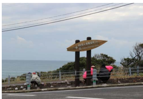
展望台への案内看板を設置