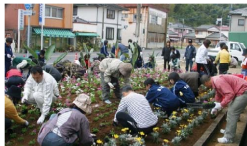
国道の分岐交差点を花壇で彩る活動

そこには、花やみどりで彩った美しい街並みや集落で、訪れる人々を出迎えたいという思いから、プランターや花壇に花を植え、水をやり、雑草をむしっている人々がいるのである。