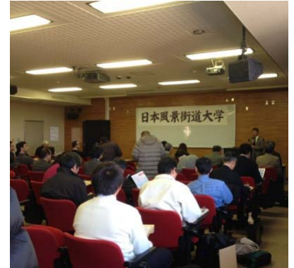
講義は宮崎大学において開催