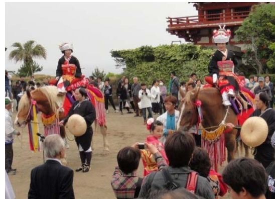
伝統行事の再現「シャンシャン馬道中」を楽しむ