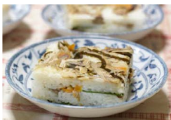
徳合五目押しずし