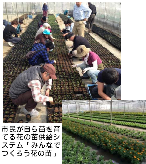
市民が自ら苗を育てる花の苗供給システム「みんなでつくりょう花の苗」

植栽活動に必要な花苗はルート全体で2万株を超える。そのうち1万数千株は、市民が自ら生産した花苗で賄っている。