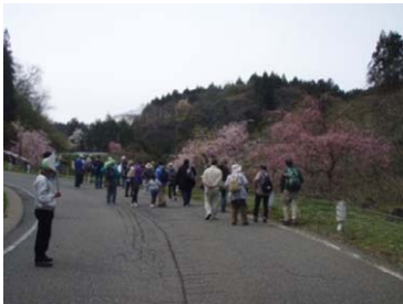
桜街道でのハイキング状況

当日は、市内はもちろん県内外の地域より、子供から年配の方が約110人参加し、満開の枝垂れ桜をバックに記念撮影をしたり、枝垂れ桜の花をカメラに収めたりしながら歩き、昼食時には豚汁とぼた餅がふるまわれるなど、徳合地区で里山の春を楽しんでいました。