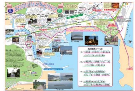
地域がつくった「まちあるきマップ」

南海トラフ・日向灘沖などの大地震は、長いサイクルで起きる。この地域のように、過去の災害の教訓を元に何百年も後世に伝え続けることの大切さ、そして、その手法などを学んだ。