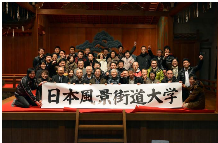
能楽堂の舞台を会場に最後の講義が終了し、達成感の笑顔あふれる記念写真