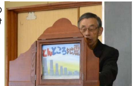
紙芝居で伝える津波防災教育