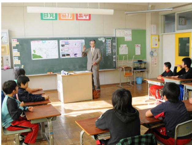
学校SBW 授業風景(SBW思想の継承)

さらに、マップを使用して自分の地域をPRし、地域活性化を目指すことも重要と考えました。他地域の同年代の子ども達が自分の住む地域を訪れた時に、作成したマップを元に地域を案内しPRする機会が得られることで、自分の住む地域への自慢や誇りを持つことができるからです。