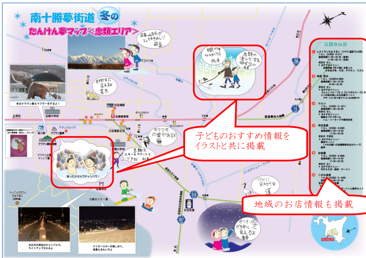
学校SBW 子ども達が考えたマップ