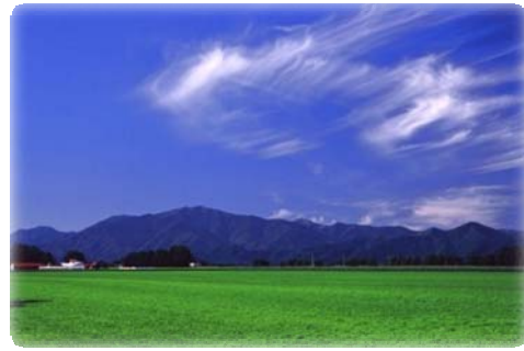
夏の日高山脈(更別村)

当ルートは、中札内村、更別村、幕別町忠類地区、大樹町及び広尾町の5町村を所管とする地域の37団体で構成され、「夢を育む海と大地と清流のみち」を活動のテーマとして、素晴らしい環境を大切にし、歴史と文化を活かしながら地域活性化を目指しています。そして、地域の子供たちに夢を与え、その子供たちが大人になってからも住み続けたい・守り続けたいと思えるような地域づくりを目標としています。