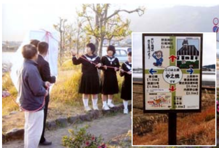
観光情報板の設置