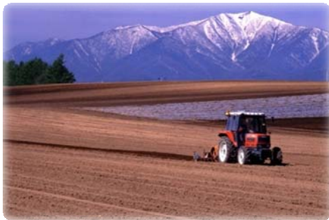
春の日高山脈(中札内村)

「南十勝夢街道」は、北海道のほぼ中央部にある十勝平野の南に位置し、ルート内には地域のどこからでもその雄大な姿を望むことが出来る日高山脈が連なり、そこから流れ出る幾つもの清流が太平洋へと注ぐ景観を形成しています。その清流の途中には、日高山脈からの恵みを背景とした豊かな農村景観が広がり、これらの豊かな自然環境や農村景観はルートの特徴となっています。