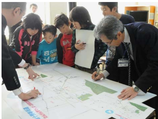
学校SBW 授業風景(マップ作成)