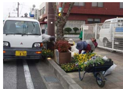
植栽の支援(花の種など購入)