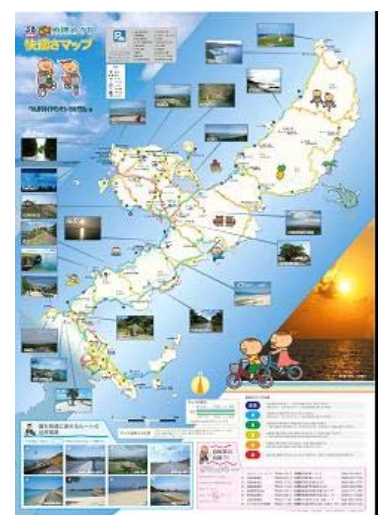
自転車版快適さマップ (全体版)