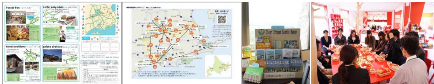
シーニックカフェマップ 移動ルート&距離早見マップ 観光情報の発信 カフェスタッフミーティングの様子

これらの活動内容は、年 2 回程度シーニックカフェスタッフミーティングで決めており、20 代のカフェスタッフが中心となり、企画や実施体制の具体的検討を行っています。