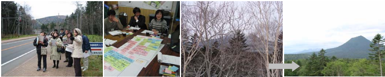
景観づくり検討会の様子(フィールド調査・意見交換) 双岳台(国道 241 号) 視点場の整備

ました。今後も、関係機関への働きかけを含め、プラン推進に向けた活動を積極的かつ継続的に実施します。