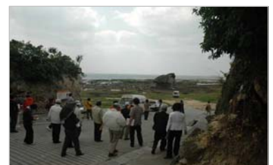
▲景観点検ツアー（平成19年3月）

南部地域には、有名無名の様々な旧跡があり、有名なものについては色々な文献で紹介されている一方、地元の人しか知らない魅力的な場所が数多くあります。そこで無名スポットを発掘し、これらスポット巡りをする事で課題を洗い出す景観点検ツアーを実施しました。