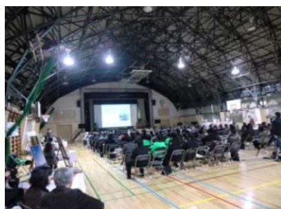
全道フォーラム2010 開会の様子