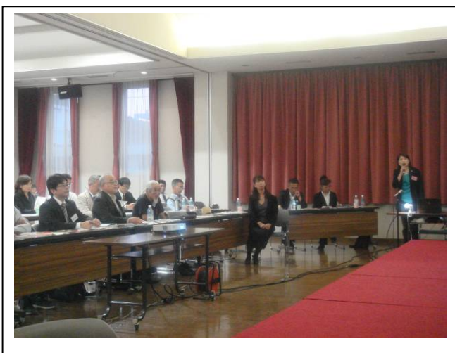
写真・4 活動報告会のようす

今年度の活動について、9ルートの代表者から報告があり、清掃活動等の沿道環境の整備・改善、フォトコンテスト、他地域におけるルートとの意見交換会等の地域資源発掘やホームページでの情報発信等の活動の報告がありました。これらの報告について、全体ディスカッションに参加いただいたパネリストよりアドバイスを頂きました。また、交流会議後の「交流会」では、各パートナーシップ間で情報交換・意見交換が活発に行われました。