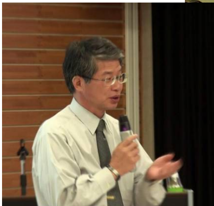
講師も受講者も一体となった討論

また、2日間の日本風景街道大学の締めくくりとして、2日目の最後のコマでは石田先生の全体コーディネートによる「協働・連携のマネジメントをどうするか？」