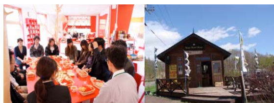
釧路湿原・阿寒・摩周シーニックバイウェイ