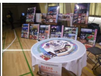
ルートテーブルの様子