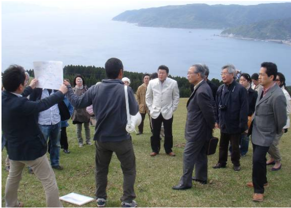
着地型観光として商品化を目指すモニターツアー

ーシップによって自立的な地域づくり活動を企画・実施し、持続可能な地域を目指す」ことを目標に実施してきました。