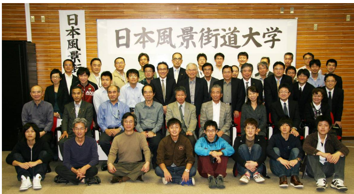
「日本風景街道大学」継続の願いを込めて撮った、講師と閉校式まで残った受講者との記念写真

なお、最後になりましたが、「日本風景街道大学」は、宮崎大学、日本風景街道九州ネットワーク、シーニックバイウェイ支援センター、道守九州会議、都市計画学会九州支部、風景デザイン研究会、九州建設弘済会、国土交通省九州地方整備局、宮崎県、宮崎市、日南市、串間市のご後援をいただき、開催いたしました。ここに関係機関のご理解とご協力を厚く感謝申し上げますと共に、今後も引き続きご理解とご支援をいただきますようお願い申し上げます次第です。