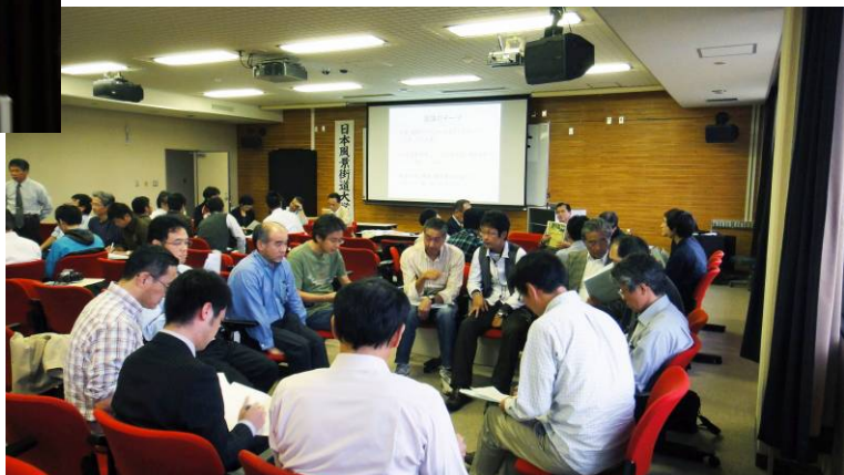
課題解決のための討論にも熱が入った

「かね(活動資金)はどのように得るのか?」「地域資源の発掘と再発見の方法は?」の3つをテーマとしたワークショップを実施しました。講師陣も含め、様々な立場の参加者が混ざり合っ