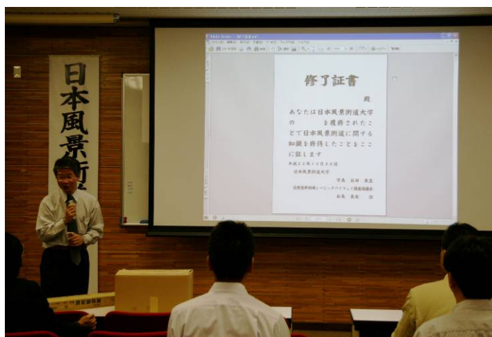
受講者のみなさんには修了証書が授与される

他方、懇親会やアンケートからは「一般の参加者には難しかった」、「どちらかといえば行政向きだったのでは？」とのご意見もいただきました。今回は、「第1回日本風景街道大学」であったこともあり、テーマを理念的なものに設定しましたが、今後は風景街道活動に参加されている市民の方々、観光関係者、地元企業、あるいはまちづくり活動を担っているの方々等、多様な方々を対象としたテーマ別講義も必要であると考えています。