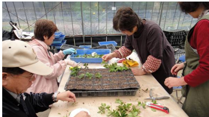
花苗の生産から植栽活動までをめざす「うつくしの道づくり」

日南海岸きらめきラインは平成19年11月の風景街道認定より、「うつくしの道づくり」「いやし・もてなしの道づくり」「神話・歴史のみちづくり」の3つを柱に様々な活動を実施してきました。特に、ルート全体としては「うつくしの道づくり」として景観診断、花で地域を結ぶ一斉活動、花の苗供給システムづくりを、「いやし・もてなしの道づくり」として地域との交流によって着地型観光をめざすモニターツアー、テーマで地域を結ぶモニターツアーを、「神話・歴史の道づくり」として旧街道の発掘調査、神話読本の発行、神話語り部モニターツアーを行ってきました。