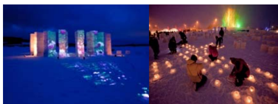
大雪・富良野ルート

昨年度の「ベスト・シーニックバイウェイズ・プロジェクト2009」最優秀賞に選ばれた2つの活動を紹介します。各ルート代表より、これまでの活動への取り組み姿勢や広がり、継続に向けた今後の視点などが述べられました。