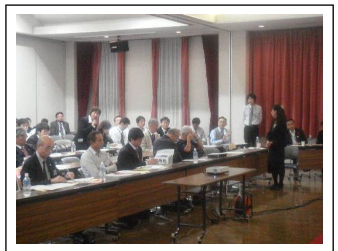
写真・5 活動報告会での質疑応答のようす