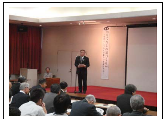
写真-1 開催地・糸魚川市長のあいさつ