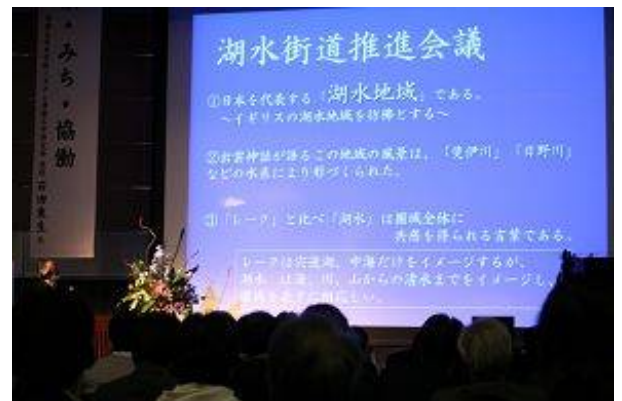
パートナーシップ名称変更について説明する三代座長

今後は、正式な名称変更手続きを行った後に、新名称による活動を行っていくこととしています。