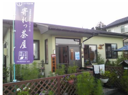
青いのぼり旗が目印の「寄れっ茶屋」