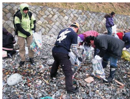
海岸清掃後のきれいになった海岸で絶叫大会！