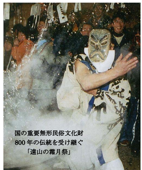
国の重要無形民俗文化財 800年の伝統を受け継ぐ 「遠山の霜月祭」