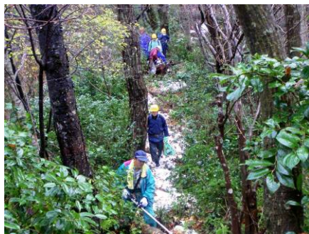
トレッキングルートの草刈