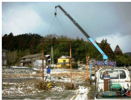
放置看板の残骸の撤去作業

重点ルートには古道や旧街道・山道のトレッキングルートがあるため、定期的に草刈りや倒木処理などの整備をするほかに、時には街道脇の倒れた石碑の復旧や痛んだ街道の砂利敷きなどの整備を行い、佐渡國しま海道の会員がガイドを勤める現地見学会やトレッキングを開催しています。