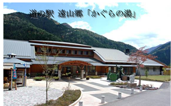
道の駅 遠山郷「かぐらの湯」