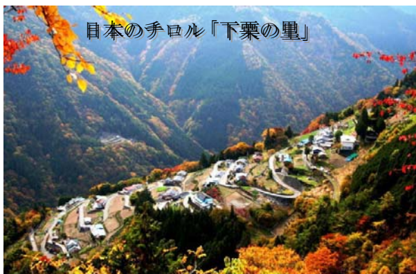
日本のチロル「下栗の里」