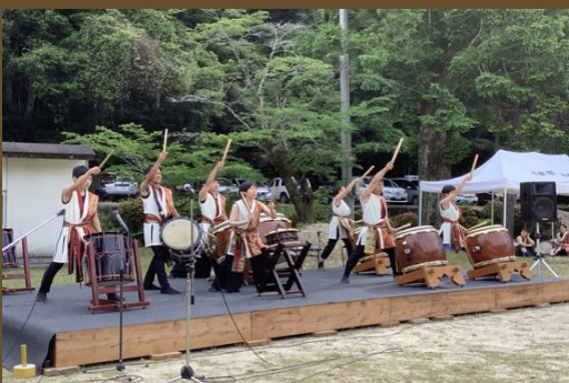
松野鬼城太鼓・ジュニアチーム森風