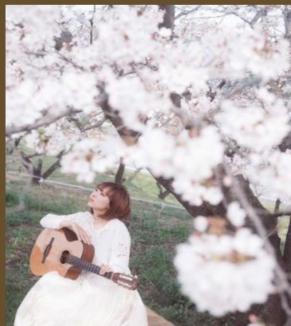
ぼうしさき (大洲市出身)