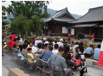
源平史跡「洲崎寺」でのライブイベント