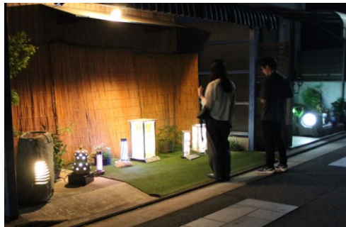
石あかり作品展示