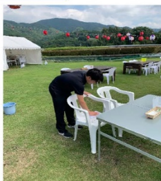
<ビアガーデンの準備の実施状況>