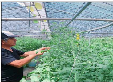
<農業収穫体験の実施状況>