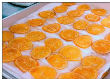
<手作り加工品体験の実施状況>