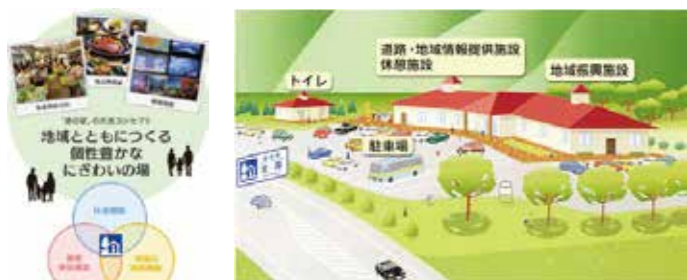
※災害時は、防災機能を発現

全国「道の駅」登録数:1,231駅 四国「道の駅」登録数: 91駅 (令和7年12月19日時点)