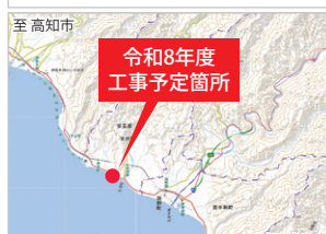
国土地理院の地理院地図に、事業箇所を追記して掲載