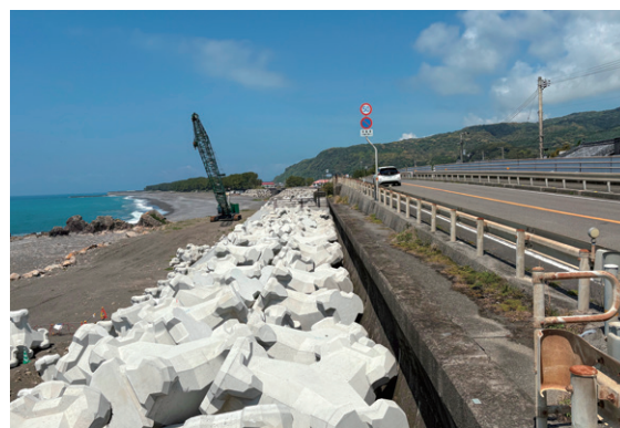
国道55号 高知県安芸郡安田町 現在の状況