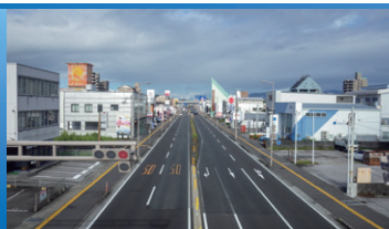
国道32号 高須地区電線共同溝(高知県)

道路の地下空間を利用して、 道路から電柱や電線をなくすことで、 「防災」、「景観・観光」、「安全・快適」のために 無電柱化を実施