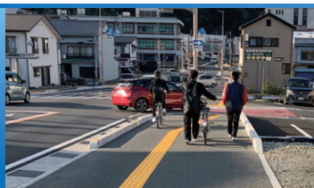
国道56号 大洲交差点改良(愛媛県)