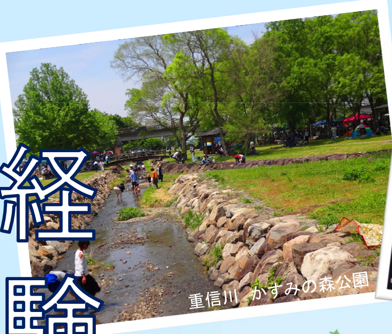
重信川 かすみの森公園