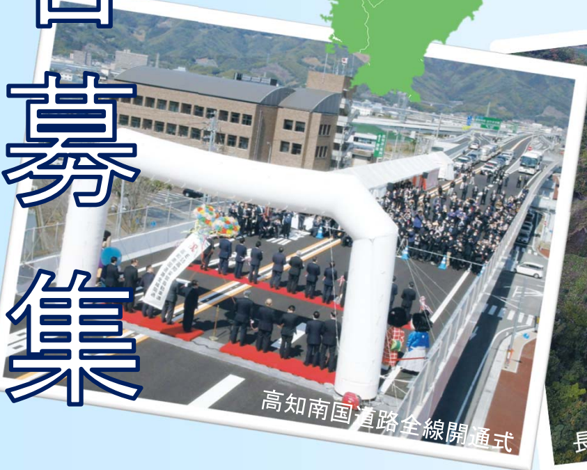
高知南国道路全線開通式