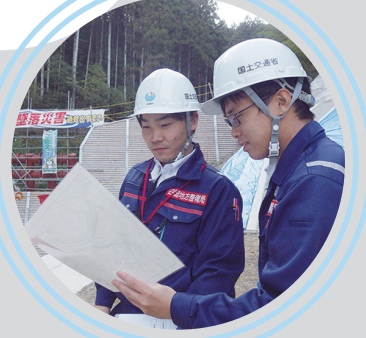
日常業務を通じての スキルアップ