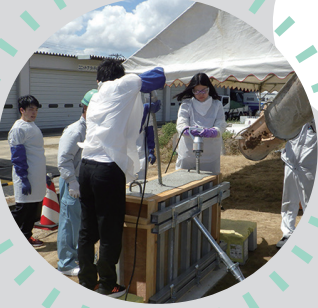
コンクリート構造物 の製作実習