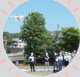
ドローンの操作訓練