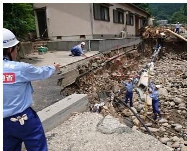
河川被害状況の調査