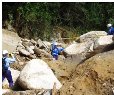
土砂災害被害状況の調査