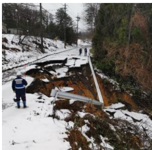
道路被害状況の調査