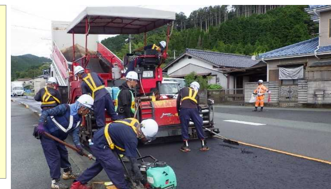
アスファルト舗装の施工状況