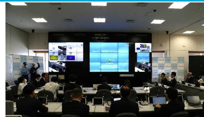
令和6年度 講習会 開催状況