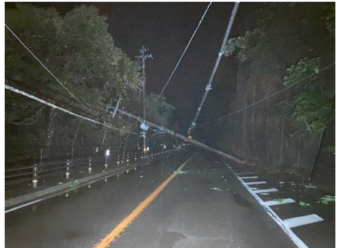
令和6年6月 倒木に伴う電柱倒壊