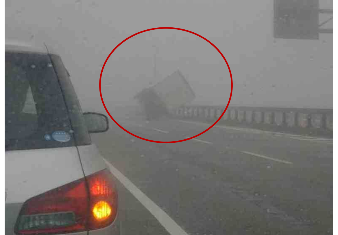
平成30年9月 台風21号 トラック横転