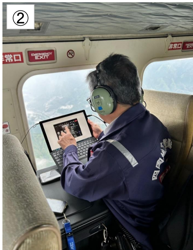
②ヘリコプターを利用した調査状況