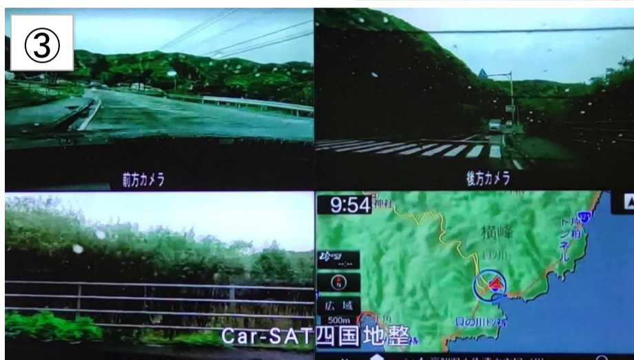
③Car-SAT(カーサット)を利用した映像