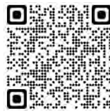
【Setouchi Vélo スポット】 登録申請フォーム