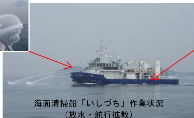
海面清掃船「いしづち」作業状況 （放水・航行拡散）