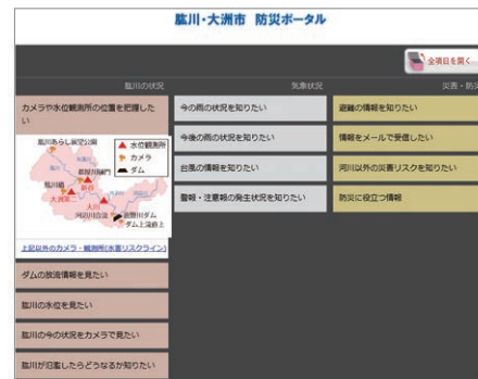
肱川 防災ポータル