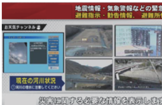
地域防災コラボチャンネル (株式会社ケーブルネットワーク西瀬戸)

住民自らの避難行動に結びつくようケーブルテレビの地域密着性という特性を活かして、洪水時の切迫した映像などをリアルタイムに届ける取り組みを始めました。また、肱川や大洲市に特化した防災情報を見やすくまとめたポータルサイトの運用を開始しました。