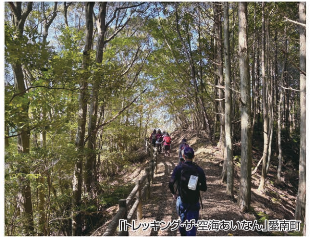
「トレッキングが空海あいなん」愛南町