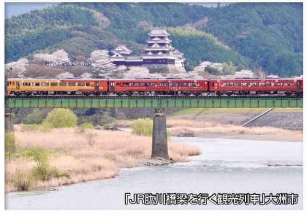
「JR肱川橋梁を行く観光列車」大洲市