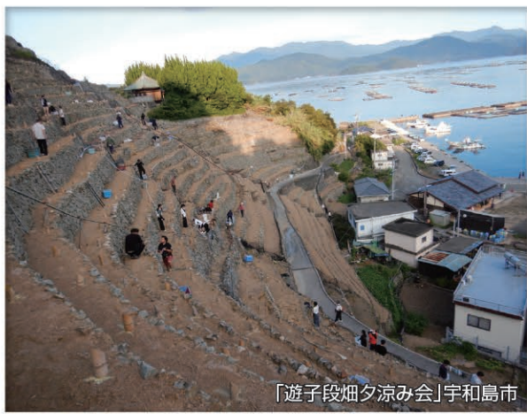
「遊子段畑夕涼み会」宇和島市