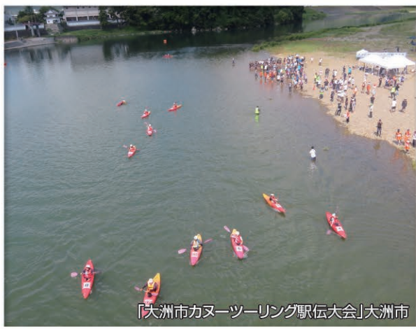
「大洲市カヌーツーリング駅伝大会」大洲市