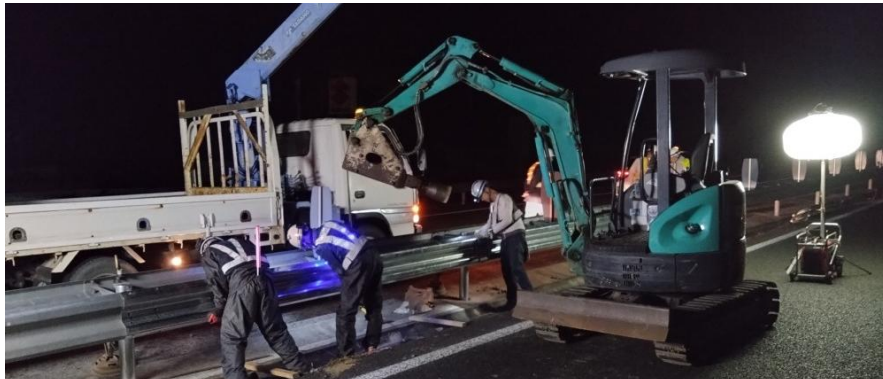
道路附属物復旧作業