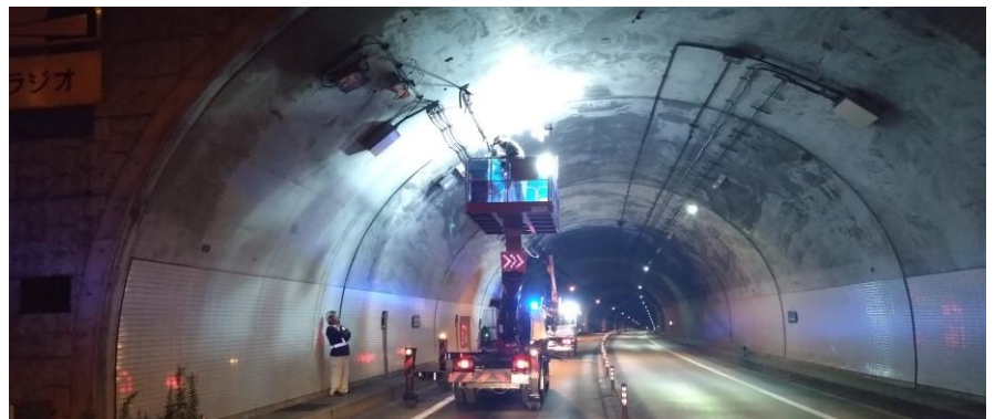
トンネル照明LED化作業