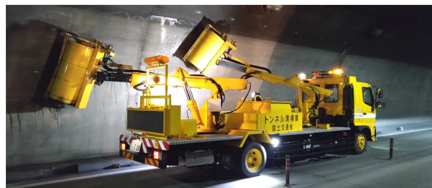
トンネル清掃作業