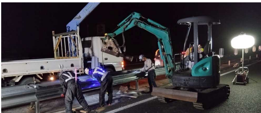
道路附属物復旧作業