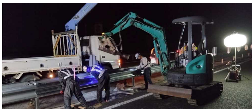
道路附属物復旧作業