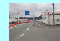
⑥薬のレディ大洲店前交差点 右折 (県道24号→国道56号)