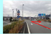
②十夜ヶ橋交差点 右折 (大洲IC側)