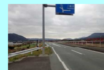
⑤畑の前橋右岸側 直進