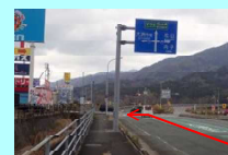
①十夜ヶ橋交差点 左折