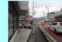
⑩ホテルオータ前交差点 直進