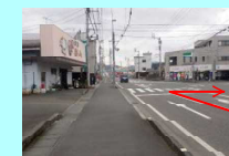
⑧焼肉金剛山前交差点 右折