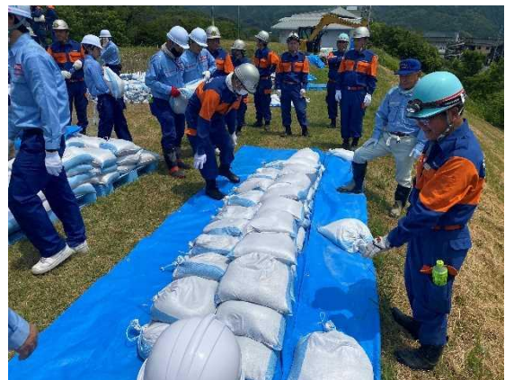
積土のう工(改良型)