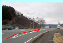
④五郎駅前交差点 右折