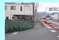
⑦マルナカ大洲店前 直進