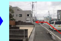
⑨焼肉金剛山前交差点 左折