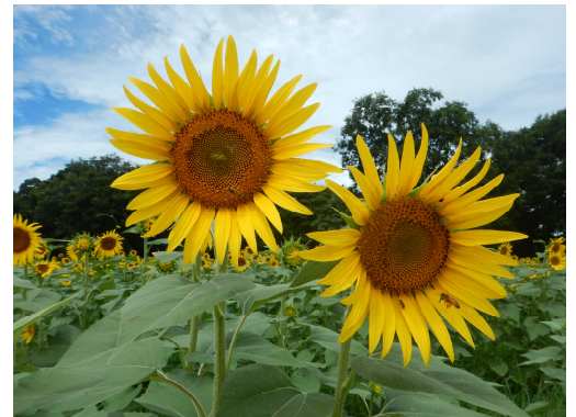
昨年度のひまわり