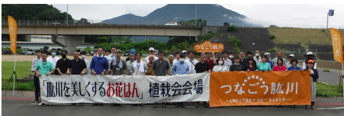
昨年度の参加状況