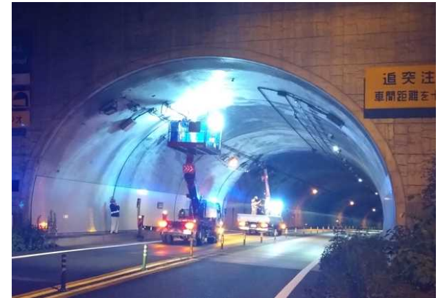
トンネル照明LED化等