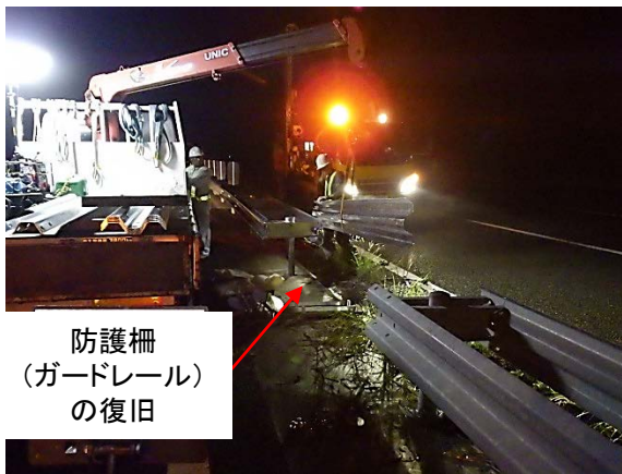
防護柵 (ガードレール) の復旧