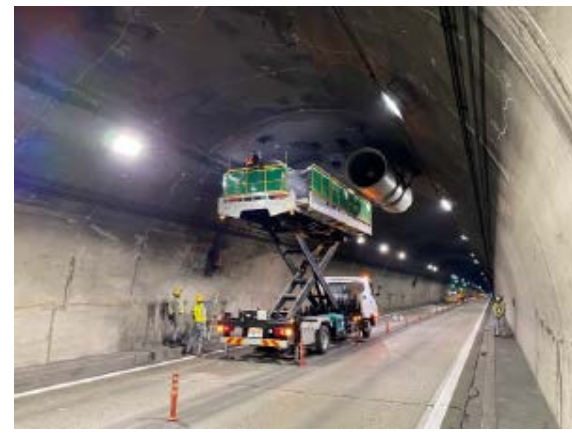
ジェットファンの設置・点検