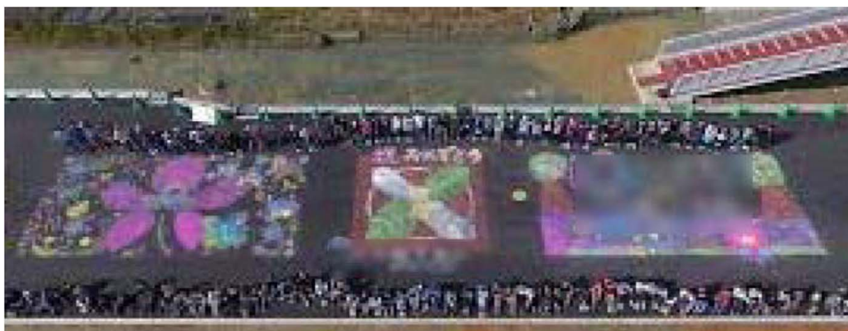
▲記念撮影の様子（イメージ）