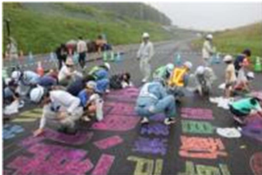
▲路面へのお絵描きの様子（イメージ）

新たに開通する道路面（基層）にお絵描きをします。完成したお絵描きは、ドローンを使って園児のみなさんと一緒に上空から記念撮影を行います。