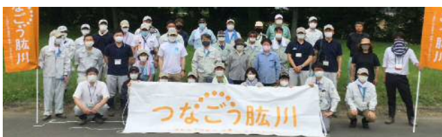
【今年の第1回植栽会の集合写真】