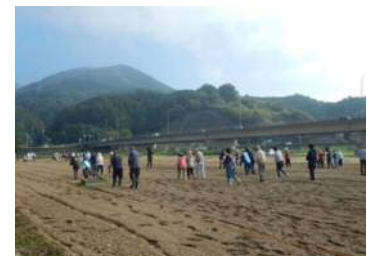
昨年参加いただいたメンバー