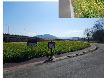
菜の花の開花状況 (R2. 2. 20)