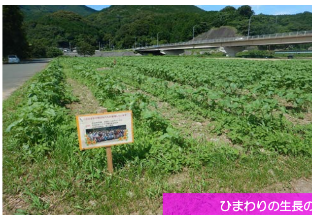
ひまわりの生長の様子（平成30年6月）