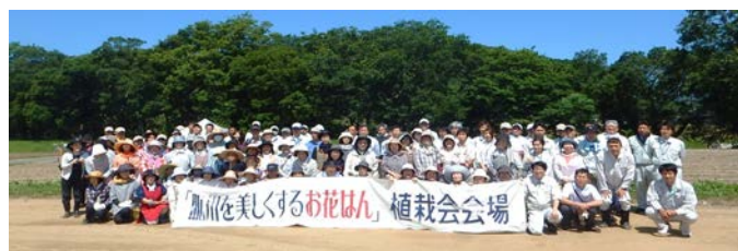
【昨年度の第1回植栽会の集合写真】