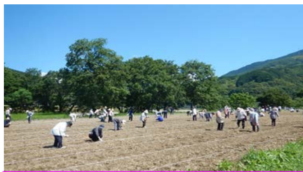
ひまわりの種まき状況（平成30年6月1日）