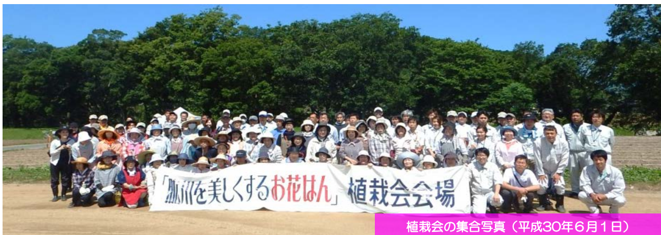
植栽会の集合写真（平成30年6月1日）