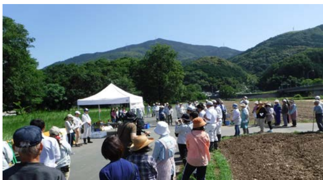
開会式の状況（平成30年6月1日）