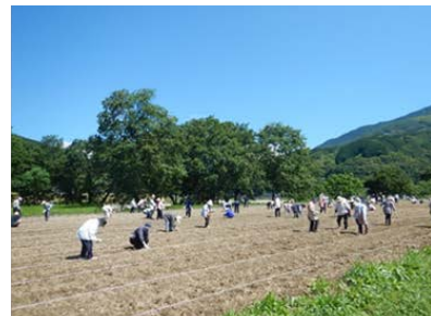
ひまわりの種蒔き状況

本施策は、四国圏広域地方計画の広域プロジェクト【NO. 3 美しい自然とおもてなしの心による「視国」観光活性化プロジェクト】の取り組みに関連します。