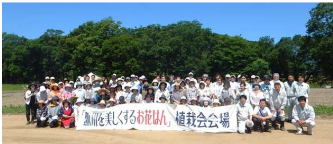
昨年度参加者頂いたメンバー