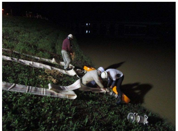
都谷川樋門での排水作業の状況