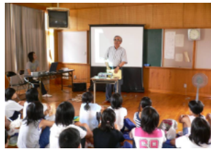
H18 初めてのツルの授業