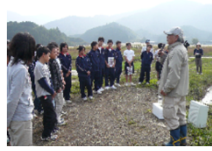
H20 澤田先生による説明