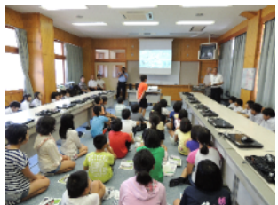
H25 小学生と中学生の合同学習