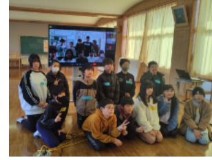
R6 オンラインでの交流