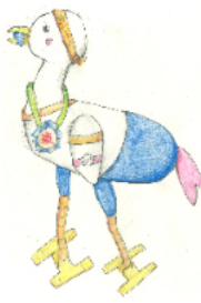
ひがなかの公式 キャラつるたん