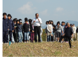
H24 佐伯会長による説明