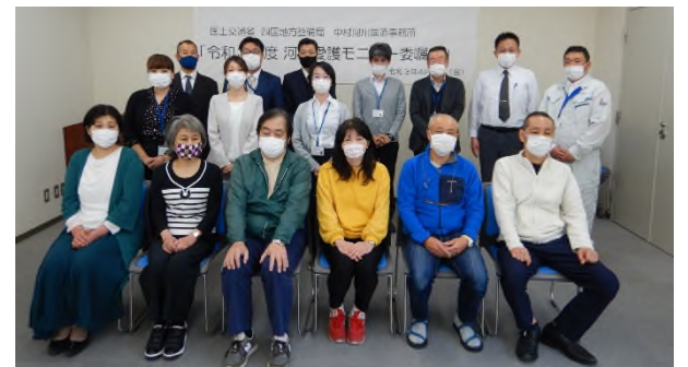
河川愛護モニターのみなさんと国交省職員 R3.4 (R4年度は中止)

河川愛護モニターは、河川整備、河川利用または河川環境に関する地域の要望の把握やゴミ等の投棄、流水の異常、河川管理施設の損傷等の発見、あわせて河川愛護思想の普及啓発を目的に行っています。 四万十川、後川、中筋川を地域住民が日々監視しています。