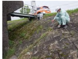
河川パトロール状況

堤防や護岸の変状を把握するほか、河川における不法行為(不法取水・不法投棄・不法占用)を監視するために、週2回程度河川巡視員によるパトロールを実施しています。 また、CCTVカメラでも日々監視しています。