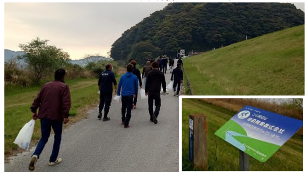
マイリバー四万十Together清掃活動 R4.4

マイリバー四万十Togetherは、四万十川を美しくしようとする意欲と行動力をもつ団体・企業等からの申し込みに基づいて、河川敷の一定区間の清掃・美化ボランティア活動を行っています。 令和5年3月末現在で11団体が活動を行っています。