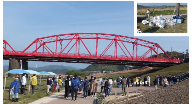
四万十川流域一斉清掃(四万十市)R4.4

4月10日は、「四万十の日」です。 毎年この時期に四万十川流域の一斉清掃を行っています。 川にゴミを捨てない意識や河川への理解や関心を深めてもらうことを目的に四万十川流域では、四万十市、四万十町、中土佐町、津野町、梶原町の5市町で住民の方が中心となり、四万十川(支流を含む)の清掃を実施しています。