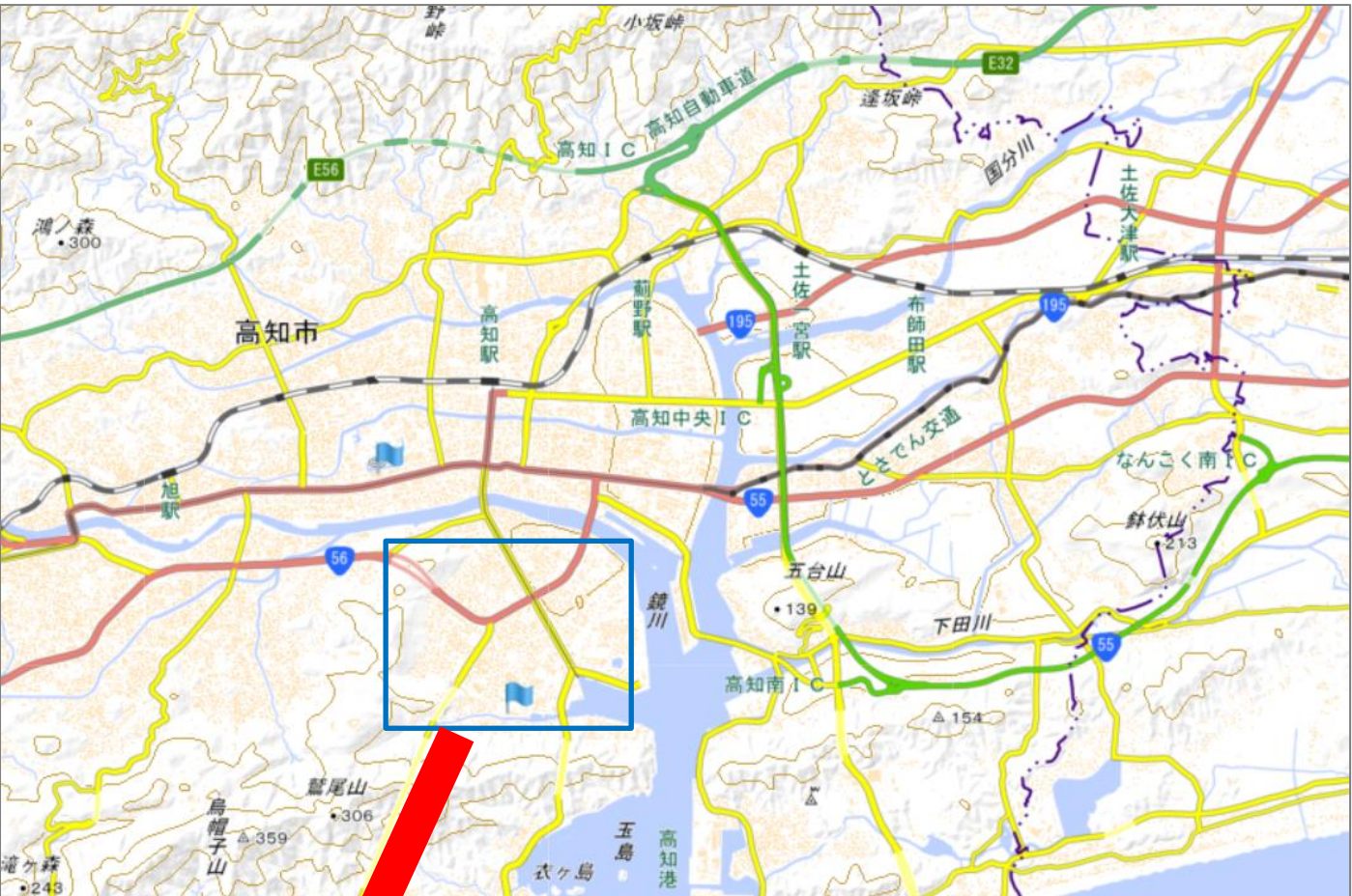
この地図は地理院地図に加筆したものである