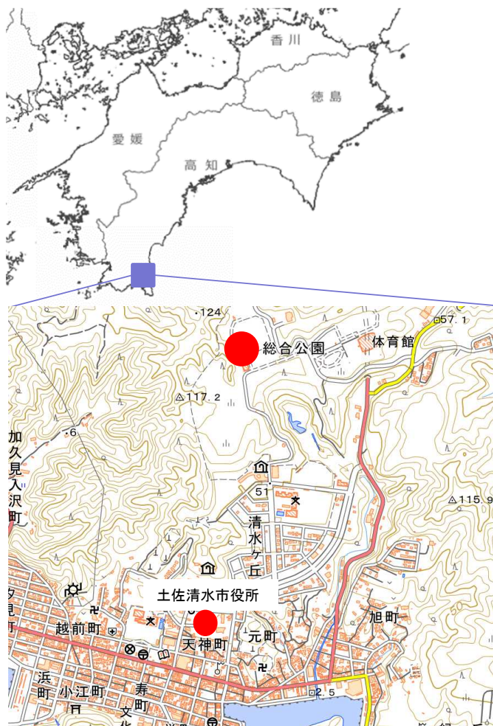
※この地図は、国土地理院の地理院地図に加筆したものである。