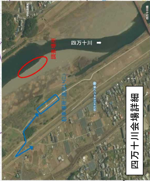
四万十川会場詳細