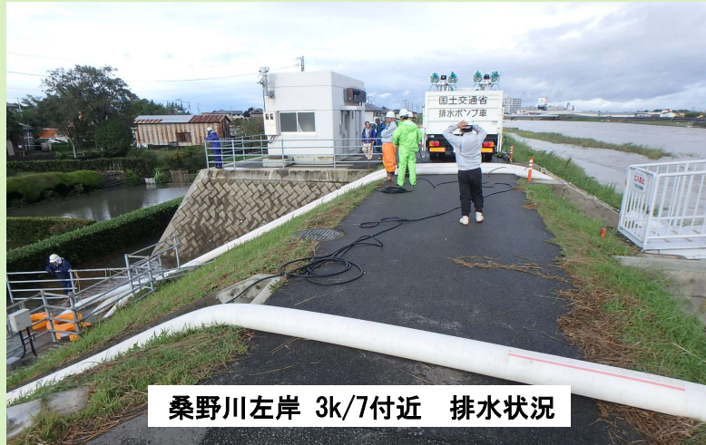
桑野川左岸 3k/7付近 排水状況