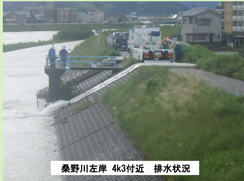
桑野川左岸 4k/3付近 排水状況