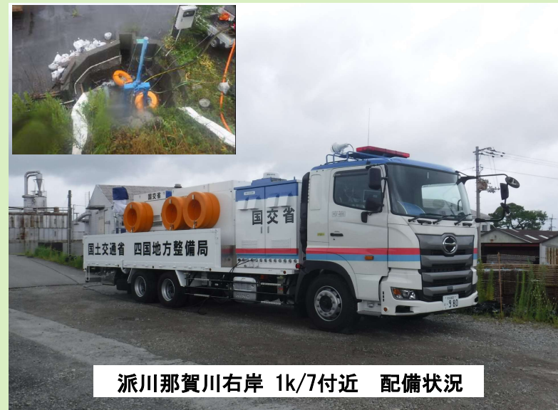
派川那賀川右岸 1k/7付近 配備状況