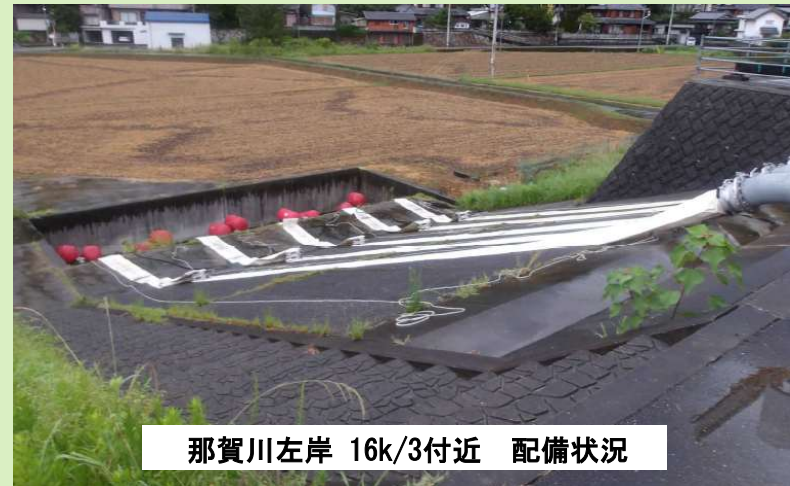
那賀川左岸 16k/3付近 配備状況